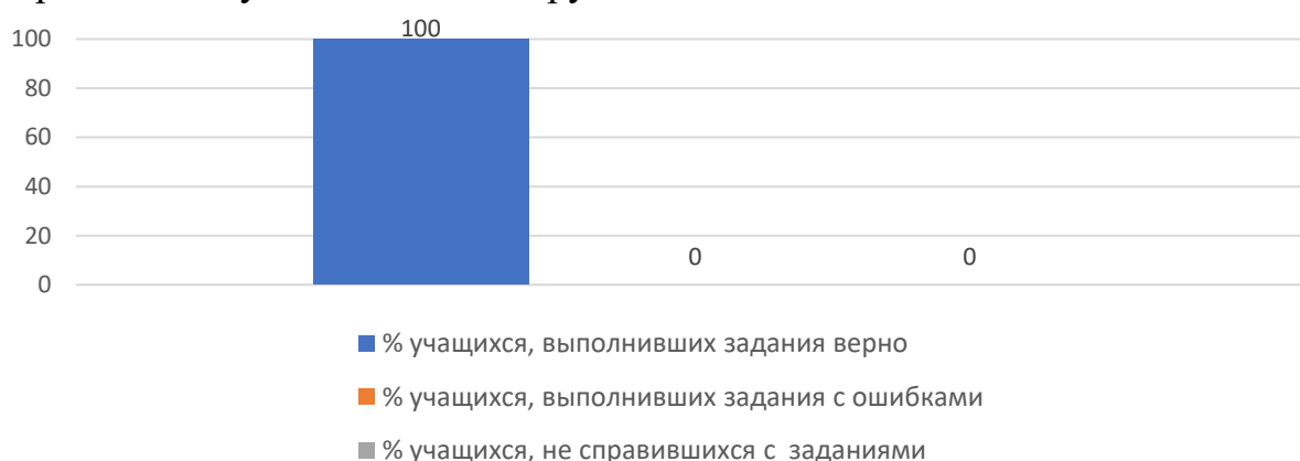
Рисунок 3. Основные результаты ДР по географии

На рисунке 3 представлены основные результаты ДР по географии в Тернейском муниципальном округе.